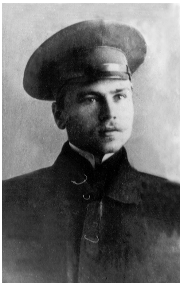
Федор Георгиевич Недосекин